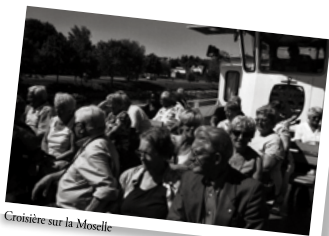
Croisière sur la Moselle