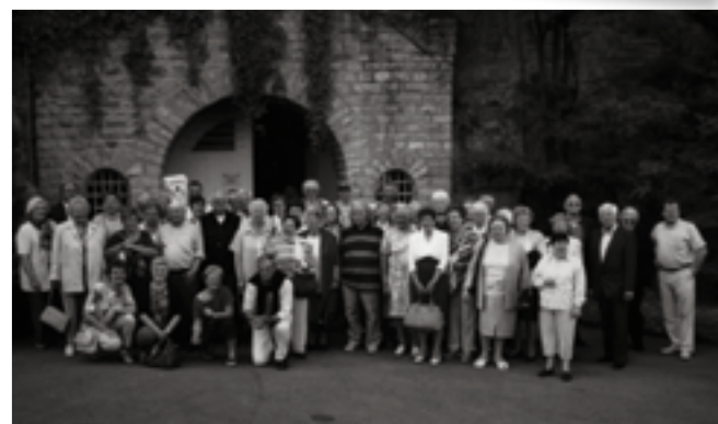
Visite des caves Saint-Martin