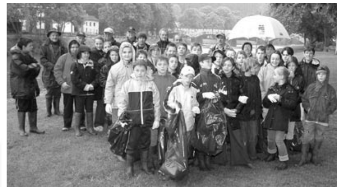
Nettoyage des berges de l'Ourthe, les enfants entourés des pêcheurs montrent l'exemple...

Je souhaite de tout cœur vous rencontrer très nombreux à cette occasion et vous remercie du soutien que vous me témoignez depuis 10 ans déjà.