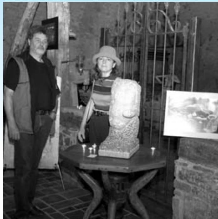
«Week-End des artistes», l'occasion de découvrir de belles œuvres dans de beaux lieux de notre commune...